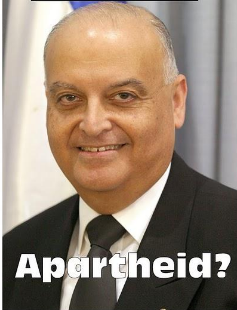
Salim Joubran, soudce Nejvyššího soudu Arab

Salim Joubran Israeli Supreme Court justice. Arab.